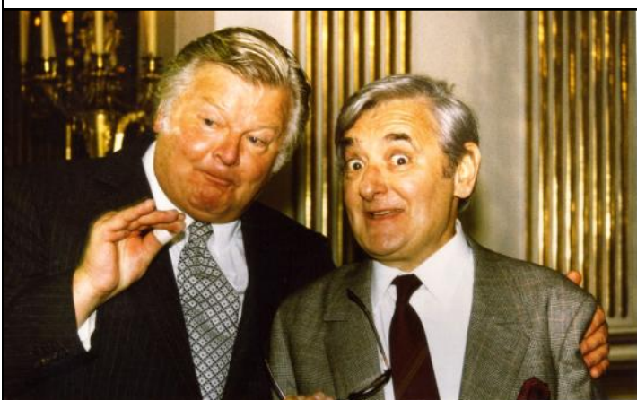
Benny Hill et Roger Carel

Le thème de la Saint-Fiacre est consacré cette année aux « Séries Télévisées » dont les épisodes influencent