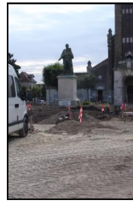
Vue depuis la loggia du Campanile : Hier et travaux en cours