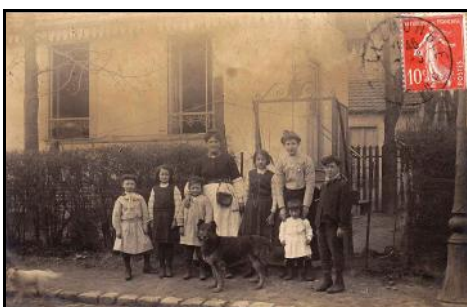
Aimablement transmis par M. Stanislas