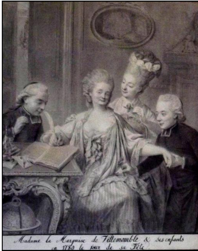
Gravure de Carmontelle représentant « Marquise » le jour de sa fête en 1780.