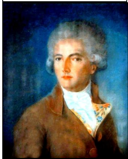
François Constantin, comte de Brossard, 1776 (Collection privée).