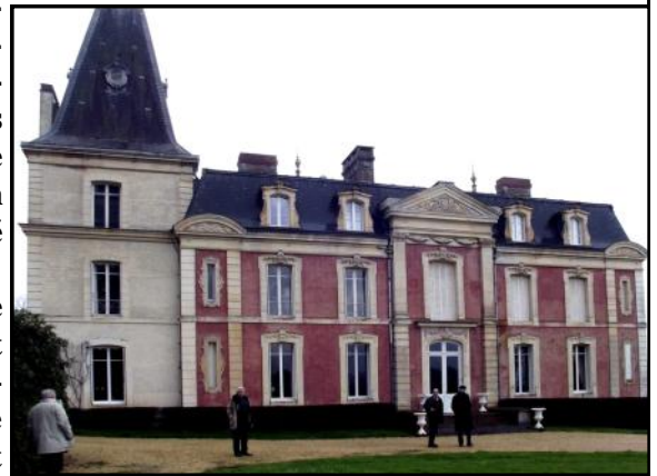
Le château des Ils (XVIIIe et XIXe siècles)