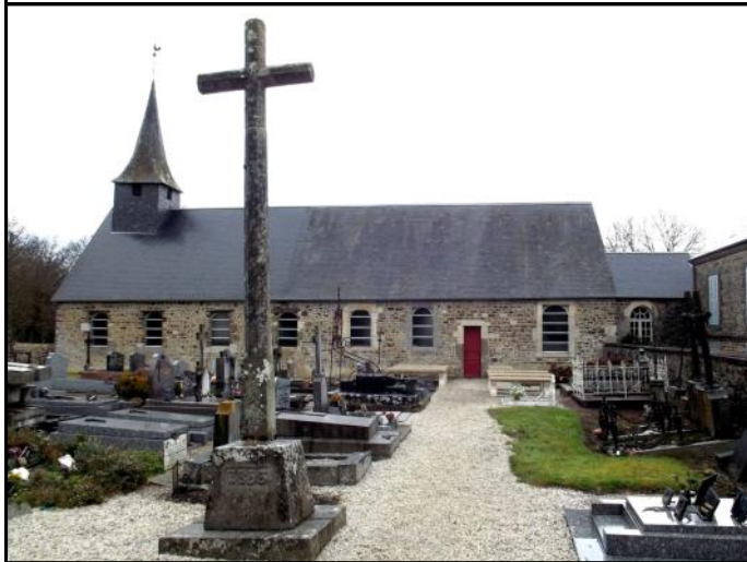
L'Église Saint-Ouen et le petit cimetière des Isles Bardel.