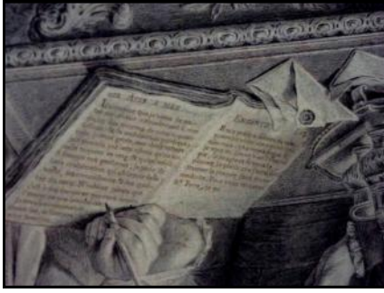
Détail de la gravure : Sa main montre du doigt un manuscrit posé sur la table où elle a écrit quelques « Avis à ses enfants ».