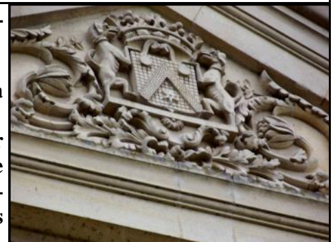
Fronton portant les armes de la famille de Brossard. (Le chevron représente l'éperon du chevalier)