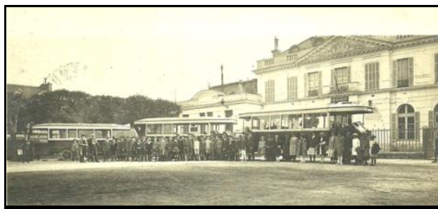
Départ en promenade Septembre 1926 Place de la Mairie

Si vous souhaitez soutenir notre action, participer à notre commission ou nous aider à acheter des archives, rejoignez l'association « LES AMIS DU CHATEAU SEIGNEURIAL DE VILLEMOMBLE ET DU PATRIMOINE VILLEMOMBLOIS » EN ADHÉRANT : Le montant de l'adhésion est toujours de 10 € pour 2013 Chèque à l'ordre des "Amis du Château Seigneurial de Villemomble" adresse : BP 34 93250 Villemomble