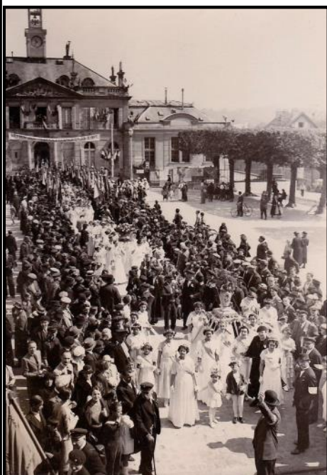
Bouquet provincial 2 mai 1937