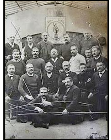
Cie d'arc de Villemomble—1906