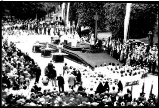
1948 - messe, place de la République, en présence du nonce apostolique Roncalli futur Pape Jean XXIII

Le « Bouquet provincial » est une fête et compétition d'archers essentiellement pratiquée en Ile-de-France, Picardie et Champagne. Le déroulement de la fête est codifié selon les traditions de l'Ancien régime ; la journée commence par l'accueil des différents drapeaux par le capitaine et le maire de la commune. En tête du cortège nous trouvons des jeunes filles de