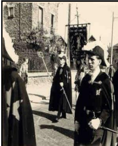
1958 - chevaliers de Saint-Sébastien Rue de Neuilly

Puis on admire les représentants des Compagnies derrière leur drapeau, avec leurs rois portant en sautoir une écharpe rouge et leurs empereurs ceignant l'écharpe verte (ceux qui ont abattu trois années de suite l'oiseau), les connétables ceints de l'écharpe violette, les officiers et les chevaliers portant l'arc ainsi que les Chevaliers de Saint-Sébastien, le cordon cramoisi liseré de blanc sur chaque côté. Des archers pratiquent le tir à l'assiette et la journée se termine place de la Mairie par un lâcher de colombes.