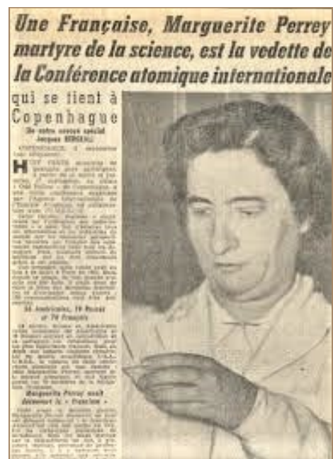
Extrait d'un article après la mort de Marguerite Perey