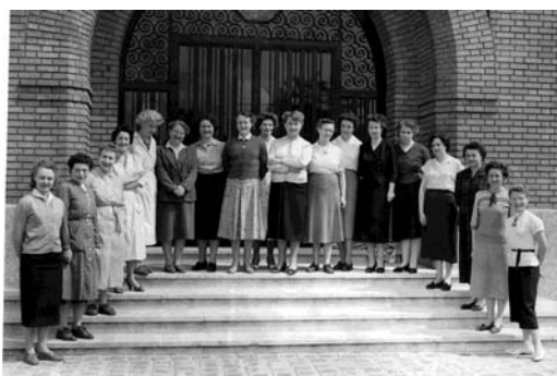
Les enseignantes de l'école des filles de Foch en 1950