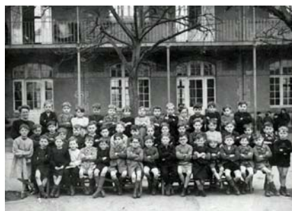
Les cours préparatoires de l'école de garçons Pasteur en 1947, anciennement école du Centre