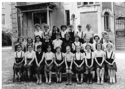
Ecole privée Sainte Julienne - Classe de 8 ème en 1951