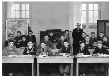
A l'école privée Saint-Louis en 1949

L'Assemblée générale se tiendra le samedi 16 janvier 2021 au château, salle Outrebon à 10h en fonction de la situation sanitaire.