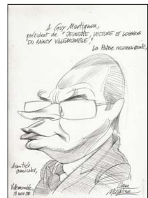
Caricature par Jean Mulatier

Alors elle ne sera pas finie l'Histoire de notre vieille cité !