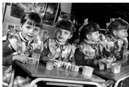
Ecole maternelle Pasteur - Grande Rue Danièle et Michelle Omé