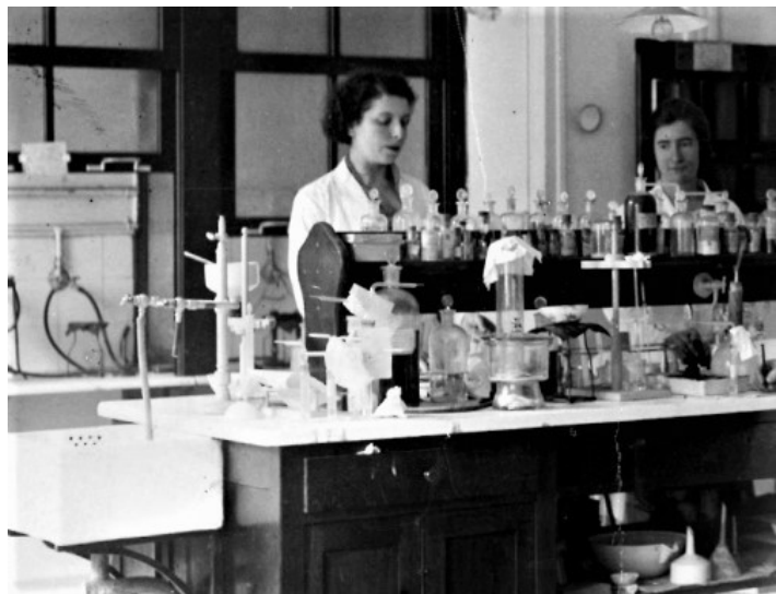
Marguerite Perey - musée Curie