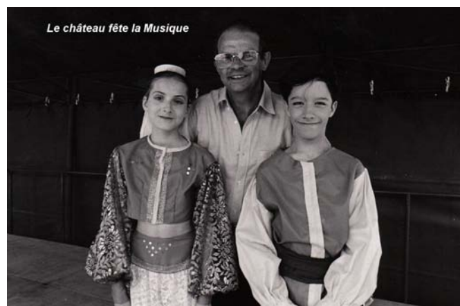
1994 - Fête de la musique