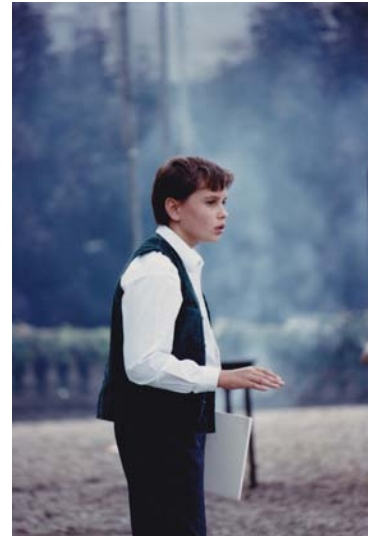
1992 - Il était une fois