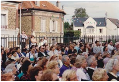
1992 - Il était une fois

Pour faire connaître leur action, « les Amis du Château » organisent chaque année la fête de la musique sur un podium face au château et participent à diverses manifestations culturelles, « Le livre en fête », « Forum des associations de sauvegarde du patrimoine », « le salon du vieux papier », « le salon multicollections de Livry et de Villemomble ». Des livres sur l'histoire de la cité sont écrits et publiés. Une pièce de théâtre intitulée « Il était une fois...le château de Villemomble » est écrite par M. Martignon et interprétée devant le château, lors de la fête de Saint-Fiacre, par l'atelier théâtre de Blanche de Castille « Grimes et Rimes ».