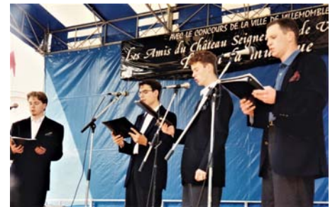
1995 - Fête de la musique