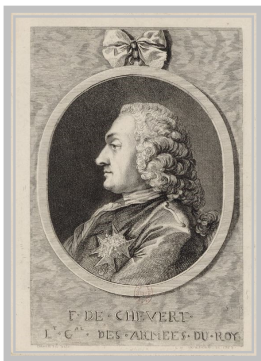
Portrait de François de Chevert