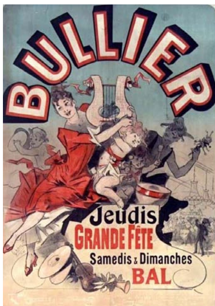
Bal Bullier 1888 Jules Chéret