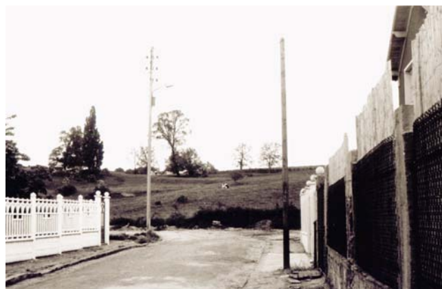
Rue Villebois-Mareuil et le Champ aux vaches dans les années 50

Vous pouvez découvrir cette gazette ainsi que d'autres photos, sur notre site : http://amischateau.free.fr