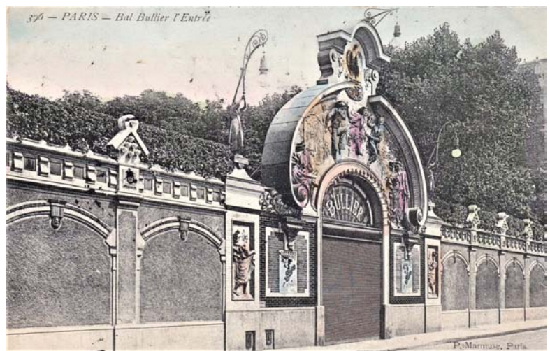
Bal Bullier Paris