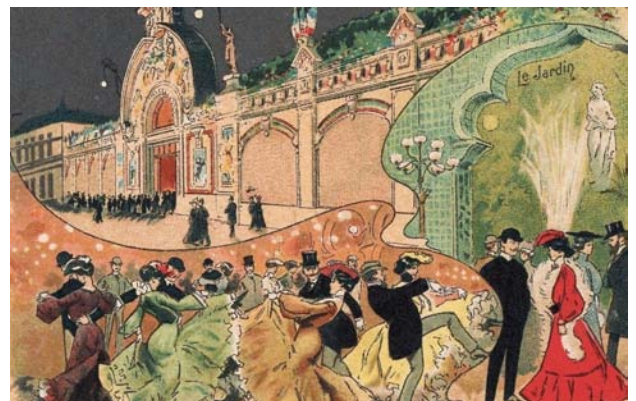
Bal Bullier Paris

Elle sera l'inspiratrice des 25 poèmes du recueil Chansons pour elle paru en 1891.