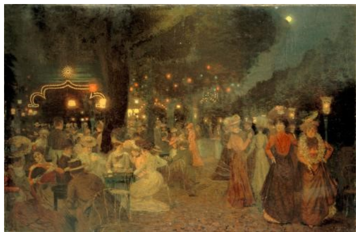
Bal Bullier Musée Carnavalet