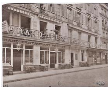
Ancien Café Procope

« Puisque Marie m'en appelle Je vous dois de la comparer Au mois de juin, aux fleurs des prés Marie aux fleurs est parmi elles Une meilleure qu'à goûter On trouverait du goût au miel »