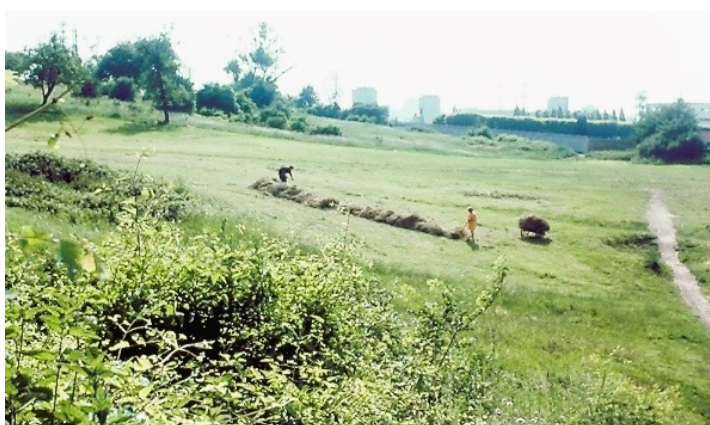
Les prés dans ce coin du plateau d'Avron dans les années 50