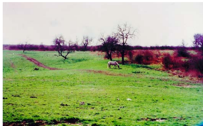
Le Champ aux vaches