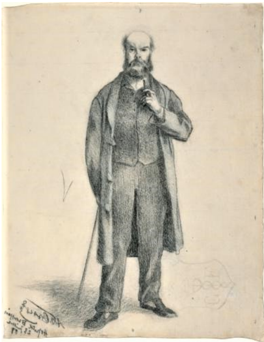
Paul Verlaine Hôpital Broussais Juillet 1888