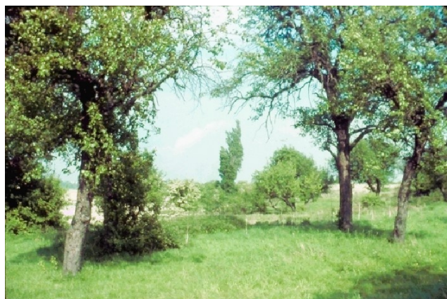
1955 - Le Champ aux Vaches au bout de la rue Villebois-Mareuil

L e long du nouveau cimetière, il y avait encore dans les années 50 des prairies dans ce quartier agreste de notre ville ! Les habitants qui demeuraient dans des maisons paisibles et fleuries entourées de jardins qu'embaumaient les lilas et arbres fruitiers, goûtaient encore la douceur de la vie loin de l'agitation de la cité !