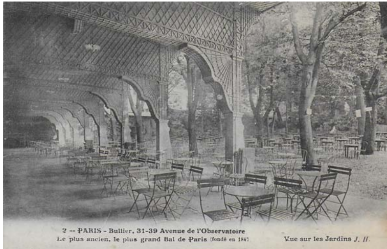
2 -- PARIS - Bullier, 31-39 Avenue de l'Observatoire Le plus ancien, le plus grand Bal de Paris (fondé en 1847)