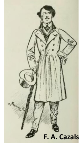
F. A. Cazals par Fernand Fau La Plume

Frédéric-Auguste Cazals décède le 2 mars 1941 à l'Hôpital Cochin, il est enterré au Cimetière de Villemomble, son épouse repose auprès de lui depuis le 2 juin 1946.