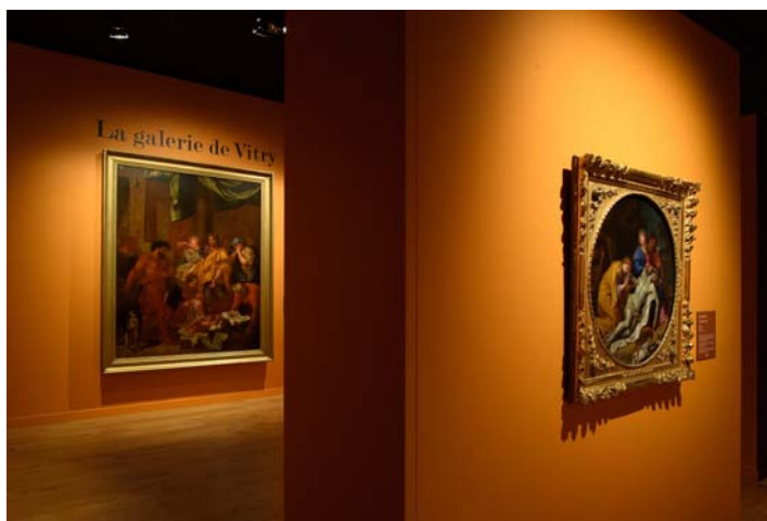
Le tableau au musée de Cherbourg