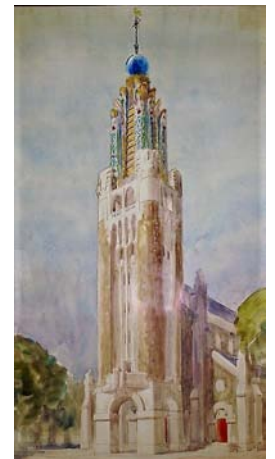
Projet de campanile par Tournon