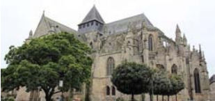
Eglise Saint Malo à Dinan