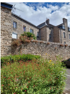
Ancien couvent des Ursulines à Dinan