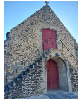
Eglise Saint-Laurent à Langrolay