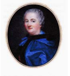
Duchesse de Villeroy

Sources : L'Arsenal - Archives de la Bastille - (dossier Lemarquis)- (dossier Vestris) - Le journal des inspecteurs de M. de Sartine - Rapports de l'inspecteur Meusnier (Un policier homme de lettres - Paul d'Estrée - Paris 1892, t. XVIII) - Almanach des spectacles à la comédie Italienne en 1752.