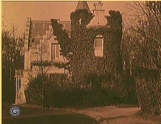
Un scandale au village Château de Maison Blanche - Gagny