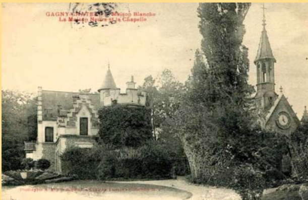
Un scandale au village - Maison neuve - Gagny