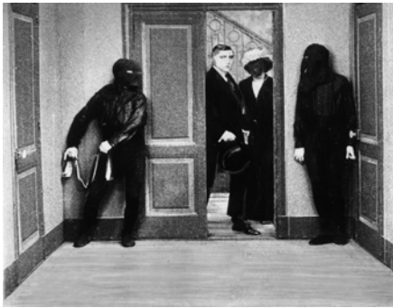
Fantômas à l'ombre de la guillotine tourné dans la villa 3 rue Huraut

Louis Feuillade fait appel à deux romanciers, Pierre Souvestre et Marcel Alain, auteurs du roman-feuilleton « les aventures de Fantômas », il va en rédiger ensuite les scénarios. Et les dialogues (L'inspecteur de police Juve, traque depuis plusieurs années un ennemi sans identité et sans visage que l'opinion connaît sous le nom de Fantômas pour ses nombreux crimes et délits). Les romans furent égale-