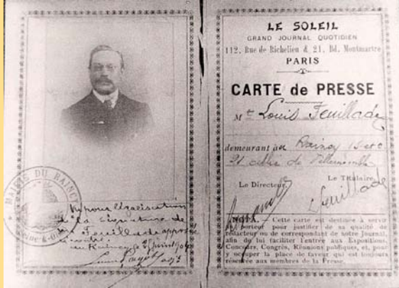
Carte de Presse délivrée au Raincy