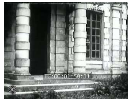
L'Oubliette Maison Rouge

naliste, Renée Carl, Lady Beltham, la maîtresse de Fantômas), « Fantômas - « A l'ombre de la guillotine », « La mort Fantastique », puis la même année « Juve contre Fantômas » (Fantômas II). Drame en quatre parties et 48 tableaux, entièrement teintés (Interp : René Navarre, Fantômas, Renée Carl, Lady Beltham, Edmond Bréon, le policier Juve...), (L'explosion de la maison de Lady Beltham dans le film était celle de sa maison de Villemomble) (4). En 1917, « Judex », grand cinéroman d'aventures et onze épisodes (Interp : René Crest,...), En 1920, « Barrabas », cinéroman en 12 épisodes. A Villemomble « Barrabas - La villa des Glycines », 3 e épisode.