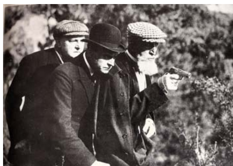
Barrabas - La villa des glycines Dans le jardin de sa villa