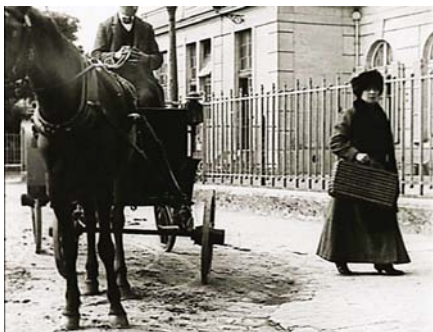
La tare Devant la mairie