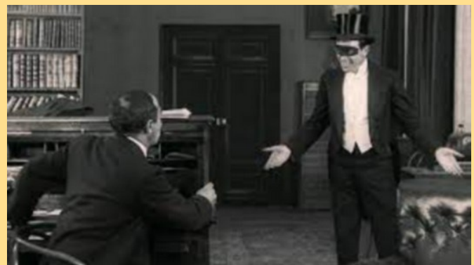
Fantomas à l'ombre de la guillotine tourné dans la villa 3 rue Huraut