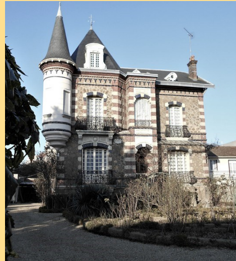
Villa éclectique construite pour le Maire M. Huraut