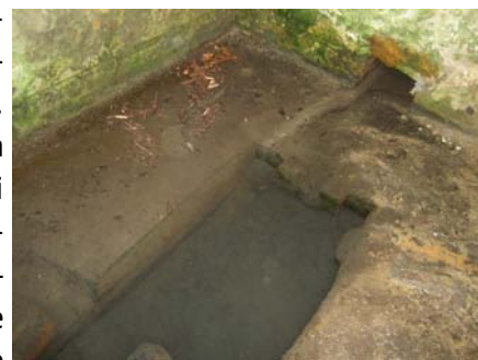
Fontaine des Enfers

Jusque vers 1872, date de l'installation de la Cie des Eaux, l'alimentation de la commune en eau potable fut assurée par une canalisation partant de la Fontaine des Enfers (Jadis Fontaine d'Enfers) (elle existe toujours) pour aboutir à travers un mur de clôture des communs du château à une sorte de bec dont on la recueillait. Elle fut plus tard prolongée sur la voie publique à l'angle sud-est de la Grande Rue et de la place de la Mairie (Emile Ducatte). Son débit était si abondant que dans la séance du 10 septembre 1892, M. le Maire proposait d'établir sur la place de la Mairie une citerne d'une contenance suffisante pour conserver les eaux « très précieuses » de la source précitée, ce qui fut fait. Plus tard, une autre citerne, encore, fut établie pour l'eau de cette source dans la cour des garçons du nouveau groupe scolaire.