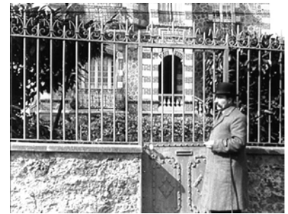
Louis Feuillade devant sa villa 3 rue Huraut

Lors de ses escapades cinématographiques en banlieue, Il envisage de s'installer à Villemomble pour se rapprocher des studios Gaumont. La ville lui plait et respire encore la campagne. Il y a de belles villas bourgeoises, une gare, des forêts, une mairie qui est un ancien château du XVIIIe siècle, bref ! Un environnement propre à tourner des films. Il remarque à quelques coquelicots de la mairie et d'une magnifique salle des fêtes « qui va lui servir pour expérimenter parfois ses films avant de les présenter chez Gaumont », une belle villa fantaisiste, éclectique, de style Art Nouveau qui se nomme « Villa Huraut », construite pour le maire de la ville. Il va l'acquérir en 1912. Il filme à Villemomble en 1912 « La Tare », drame social de « La vie telle qu'elle est » (interp : Renée Carl (2), Jean Aymé..), avec comme élément de décoration, le château. Sa maison à l'allure de manoir sera un lieu de tournage pour plusieurs de ses films comme : « L'accident » (Interp : René Navarre, Renée Carl, Yvette Andreyor) en 1912, le fameux « Fantômas » (3), en 1913, drame en 3 parties et trente tableaux, « teinté » (Adaptation musicale : Paul Fosse), (Interp : René Navarre, Fantômas, Edmond Bréon, le policier Juve, Georges Melchior, le jour-