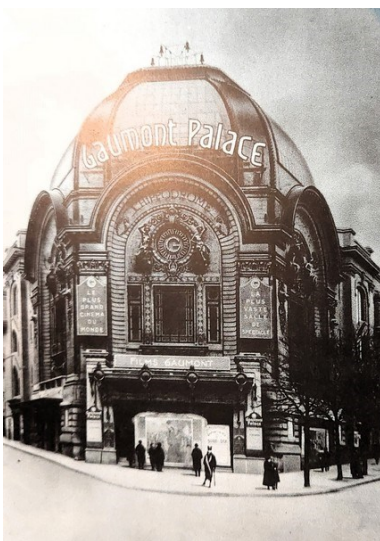
Cinéma Le Gaumont Palace Place Clichy - Paris

Louis Feuillade va quitter sa villa de Villemomble vers 1921 pour la « villa Blandine », 33 Bd de Cimiez à Nice où ont été installés des studios Gaumont. En 1921, il se remarie avec Georgette Lagneau. Ayant l'usage exclusif de ces studios Il ne vient plus à Paris que pour en faire la promotion auprès de la presse. Louis Feuillade va décéder à Nice en 1925.