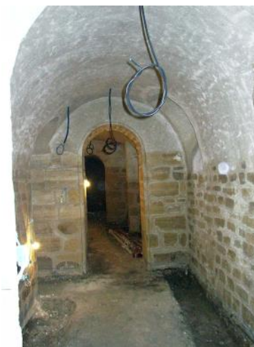
À droite : Les sous-sols

Des photos numériques ont été faites. Elles iront rejoindre les