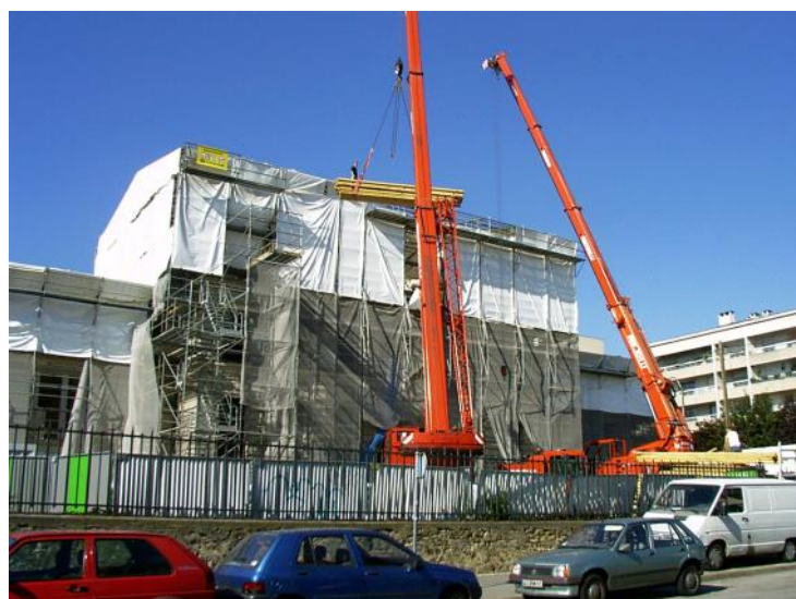
A gauche : Acheminement du bois de charpente au travers du « Parapluie »