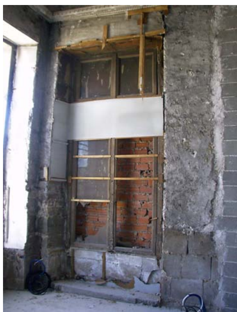
Fenêtre dégagée dans angle Nord-Est