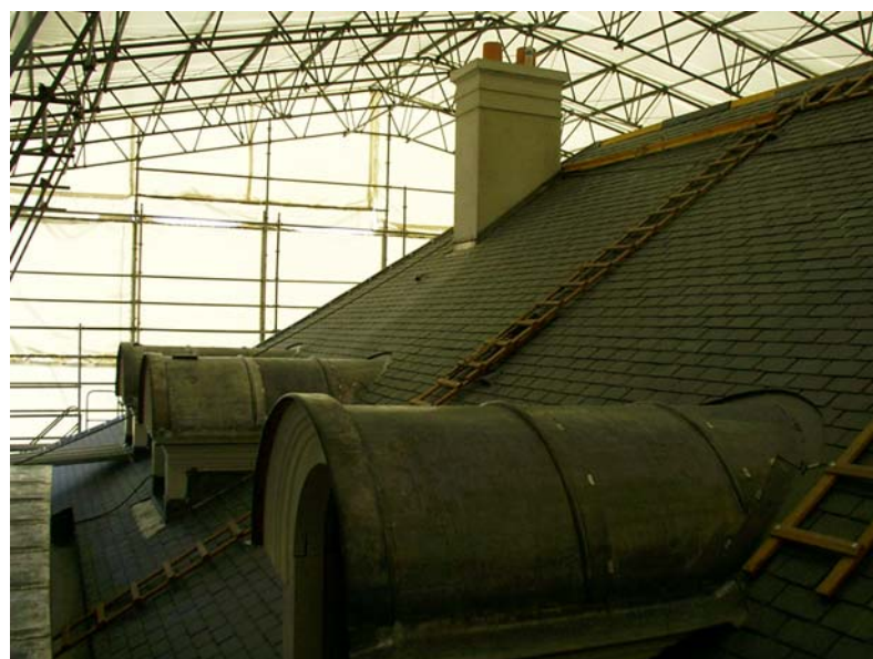
Toiture coté Nord