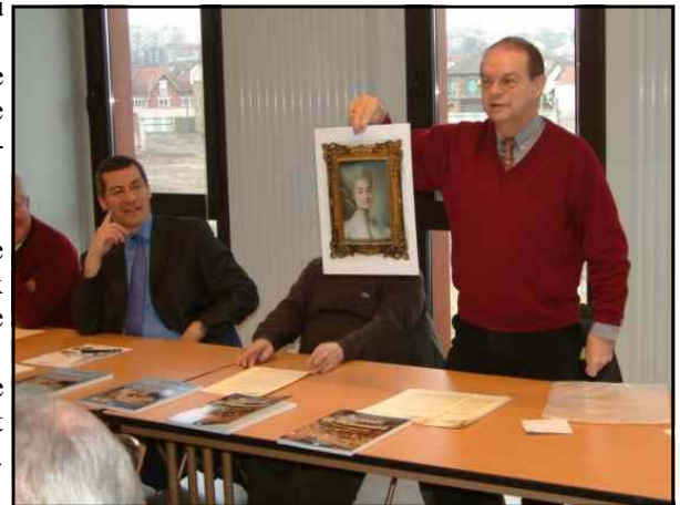
Présentation de la photo du tableau de Madame de Villemomble conservé au Louvre