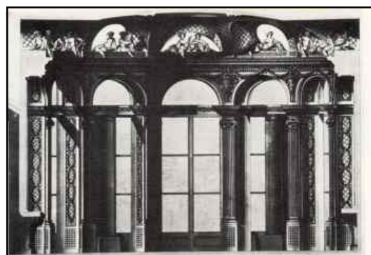
Hôtel d'Orléans - Élévation par Brongniart et H. Piètre