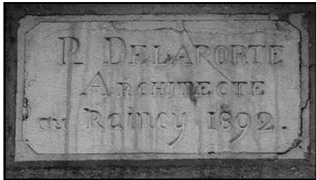
R. DELAPORTE Architecte au Raincy 1892

Les plus anciennes signatures datées ont été remarquées sur l'immeuble du 23 Avenue Outrebon et sur le pavillon du 29 Avenue du Général de Gaulle.