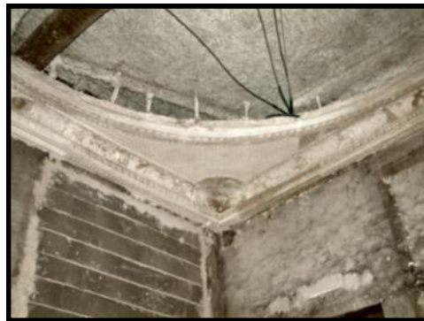
Corniche fixée en coin de plafond

Pour faire avancer les travaux de peinture en particulier, il faut chauffer l'intérieur du bâtiment . Une atmosphère sèche, comme déjà évoqué plus haut, est nécessaire pour que les couches de peinture accrochent bien. La connexion au réseau EDF n'étant pas encore réalisée, c'est avec le branchement du chantier , que l'alimentation en électricité de la chaufferie sera installée en provisoire.