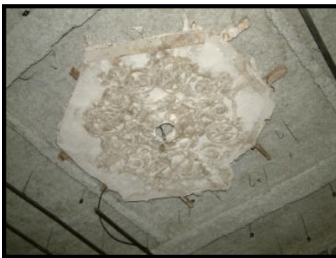
Rosace fixée au plafond