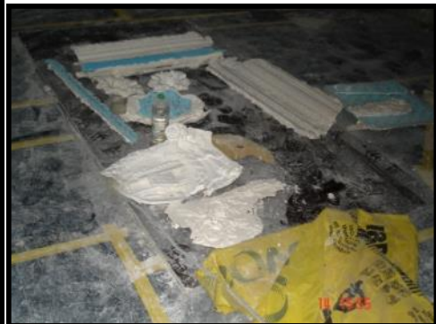
Éléments de corniche en préparation sur sol recouvert de plastique

Dans les 3 salles : boudoir , ex-salle des mariages, salle de billard, les rosaces ont été reposées sur les plafonds, les corniches vont être définitivement fixées quand les lambris de bois seront remontés.