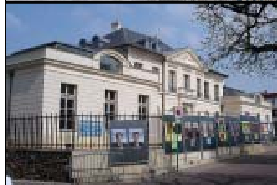
Bureau de vote