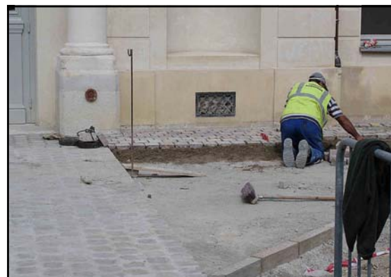
Pavement coté sud