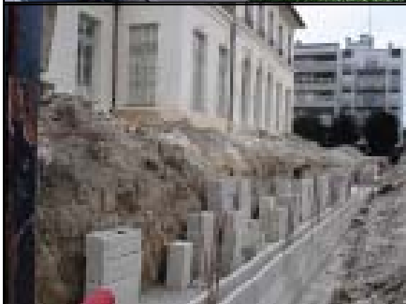
Mur de soutènement pour la terrasse coté Nord