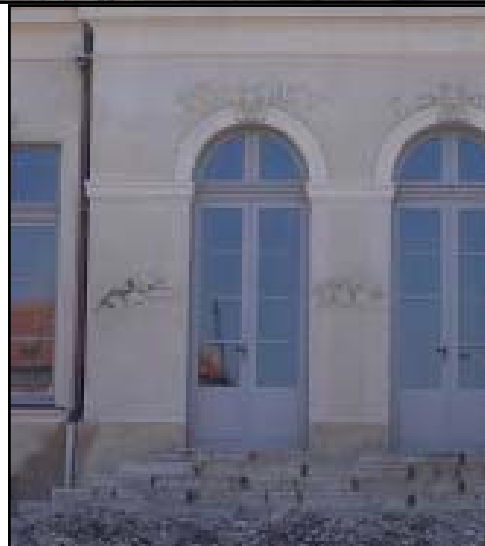
Hélas, hélas, façade nord taguée!!!