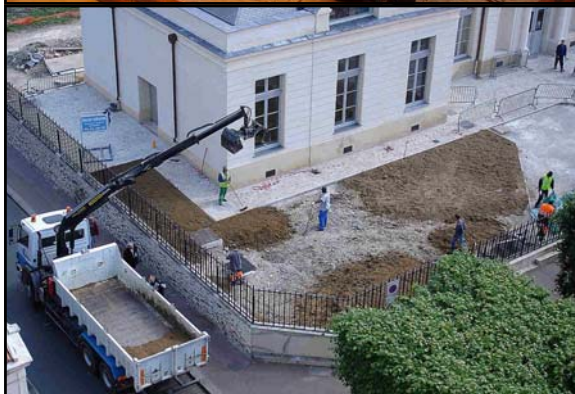
Terre végétale pour le gazon