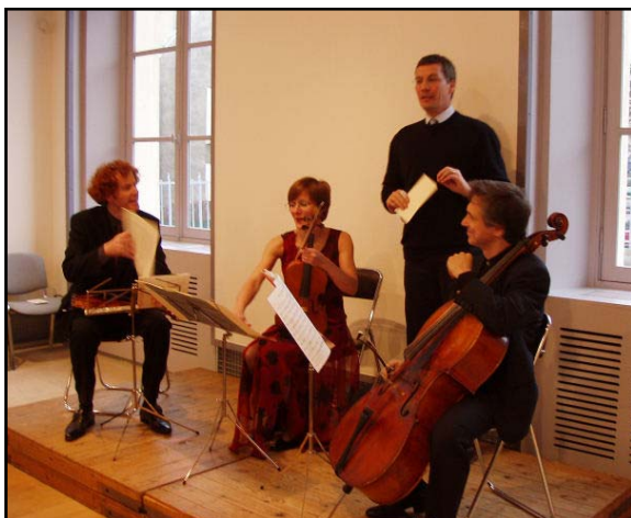
Concert de musique de chambre