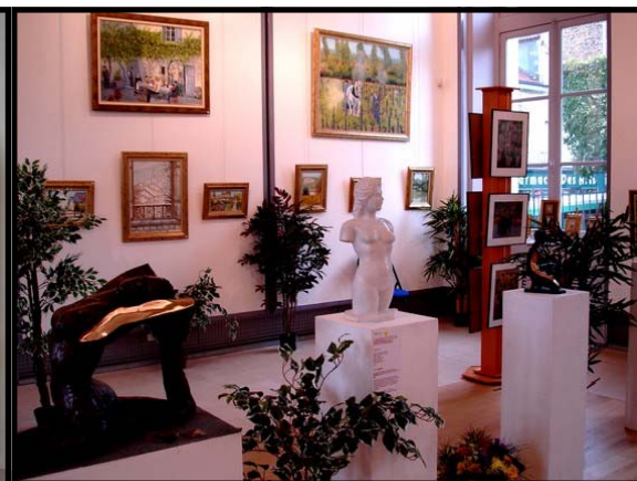
Expositions de peinture et sculpture