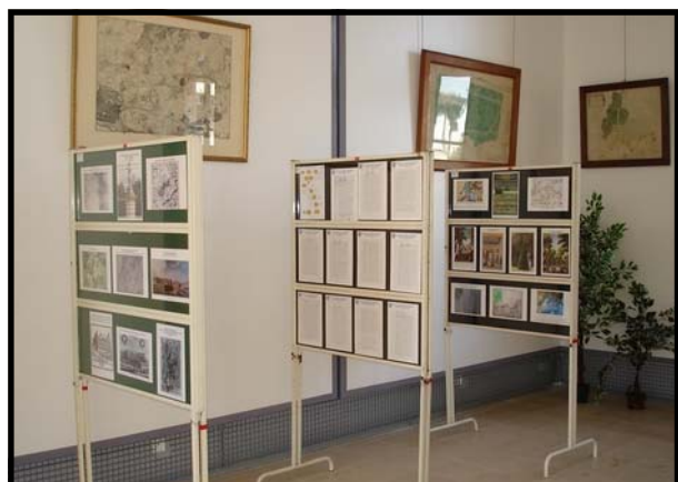
Exposition Villemomble au XVIIIe siècle