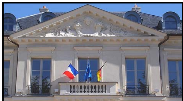
Au fronton les drapeaux du jumelage