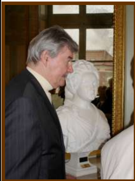
← Le Sculpteur devant son oeuvre

Autour d'un verre, les personnes présentes ont pu interroger le sculpteur sur ses réalisations et redécouvrir les salles restaurées du château. De nombreux dialogues ont été échangés entre les conseillers municipaux présents et les membres des amis du château sur les activités culturelles de notre ville, la préservation du patrimoine et les événements passés et à venir sur ces sujets.