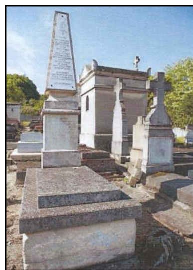
Mausolée Girardot de Launay