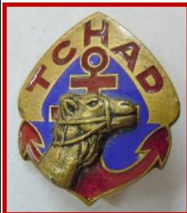
Régiment de Marche Tchad