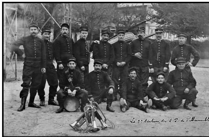
Au pied du portique (1912)

à l'angle de la rue des écoles: le Portique d'entraînement