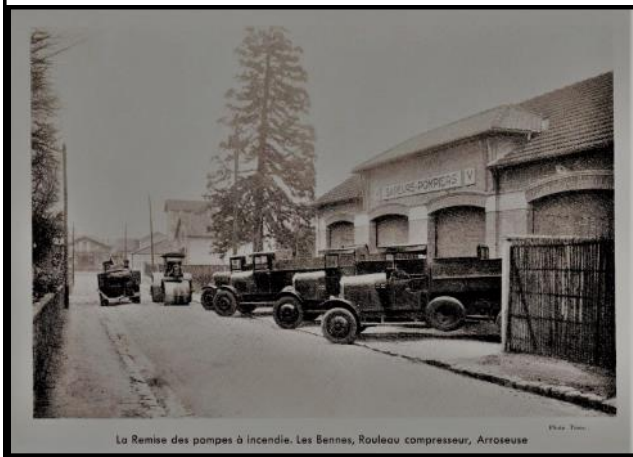
La Remise des pompes à incendie. Les Bennes, Rouleau compresseur, Arroseuse

Au siècle suivant notre cité dispose (1904) d'un corps de Sapeurs-pompiers comprenant une trentaine d'hommes. Ce dernier est alors cantonné rue Huraut où il dispose d'une belle et vaste remise de pompes à incendie (architecte Brocard). Sur son fronton est inscrit « Sapeurs-pompiers ».