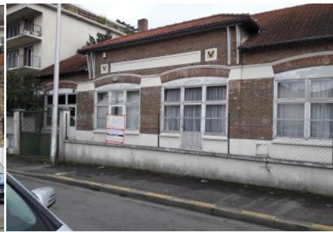
Ex caserne des pompiers Avec avis de démolition.