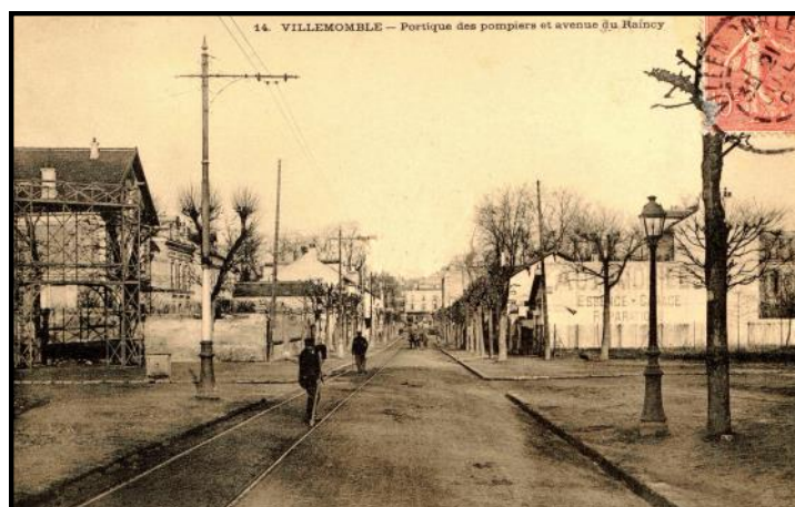
Avenue du Raincy (1901)

Les Sapeurs-pompiers reçoivent des primes et indemnités pour service incendie : 5frs50 de l'heure et 7frs50 l'heure de nuit. Il est accordé aux Sapeurs deux tenues, une de feu, l'autre de ville.