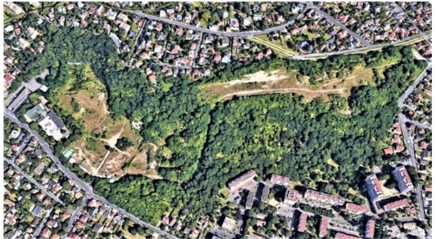
Carrière de l'Ouest — Gagny - Endroit prévu pour construction d'un collège et logements

« Les élèves du futur collège intercommunal de Gagny, Villemomble et Le Raincy doivent-ils commencer leur cycle secondaire dans des préfabriqués ? », s'inquiétaient plusieurs élus de toutes tendances, en raison du retard pris pour sa construction sur les carrières de l'Ouest à Gagny (1). En effet il fallait investir entre 25 et 40M€ pour combler l'ensemble des carrières. L'Etat ne peut investir, le site étant privé. Seule solution pour financer les travaux, vendre le droit de construire à des promoteurs ! Ces derniers ont prévu 2000 logements.