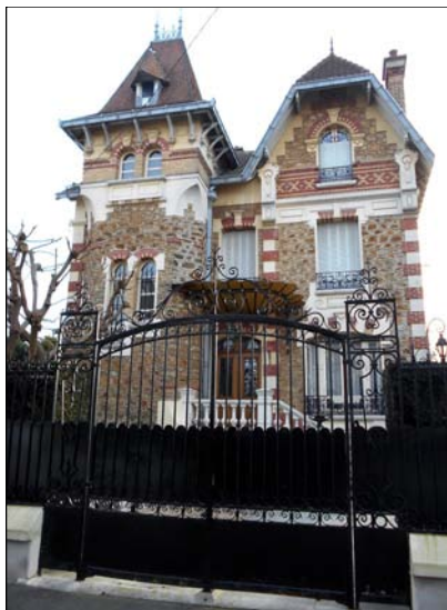
23 allée du Centre3 - Grille fer forgé - meulière - crête de faitage sur toit donjon - toit avec demi-croupe - déco tuiles vernissées -

sur EBay, c'est inconcevable ! Il serait bien qu'une ville comme Villemomble ait dans le château, un musée et que l'association des Amis du château ne soit plus logée dans des endroits inconfortables et malaisés d'accès en dépit des règles sanitaires. Il faut rappeler que les abords du château et de l'église Saint-Louis doivent être protégés, surtout dans le cadre de la rénovation du plan local d'urbanisme. Il est anormal qu'une résidence ait été construite dans le champ de visibilité du château sans l'opposition de l'ABF et qu'une autre au n° 15 de l'avenue Outrebon soit édifiée !