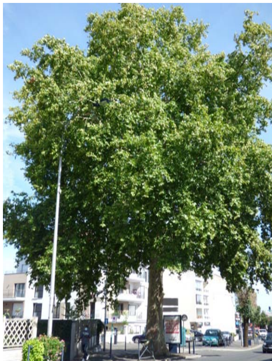
Platane - Grande Rue Arbre remarquable

Président fondateur des « Amis du Château Seigneurial »