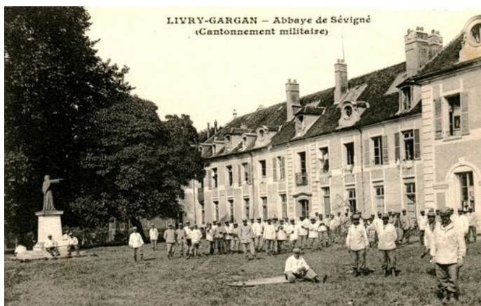
Abbaye de Livry Gargan

1785 et dont le domaine fut vendu après 1900 à des lotisseurs.