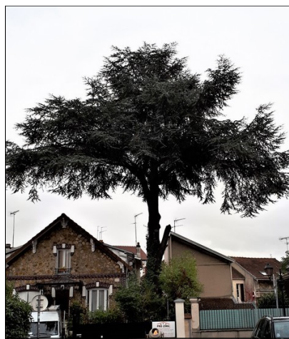
Cèdre - rue du Potager

Il faut en effet continuer à aménager les espaces publics majeurs (parvis, places, jardins) et embellir les entrées de la ville. Il serait utile lorsque des ateliers sont délaissés (comme l'ancien atelier de sanitaire, rue des Capucines) ou dans l'avenue de Rosny (commerces divers...) de les faire préempter par la commune si ils sont en vente ou si il y a risque de péril, pour en faire des lieux pour la police municipale, des parkings entourés de jardins, car où se garer pour ceux qui veulent se rendre dans un magasin. L'idée d'une mairie-annexe est intéressante pourquoi ne pas la localiser dans la première mairie-école du nord-est parisien construite en 1848 (Angle rue de Neuilly). Si nous voulons que le patrimoine de notre cité soit pérenne il serait peut-être utile de sensibiliser les scolaires à un parcours « d'éducation artistique et culturelle », avec des ateliers pédagogiques, ludiques, ateliers de dessin, concentrés sur des thématiques comme : L'Histoire, le Patrimoine, la Biodiversité, les lieux de mémoire, etc. Villemomble pourrait alors mériter le label « Villemomble, Ville d'art et d'histoire ».