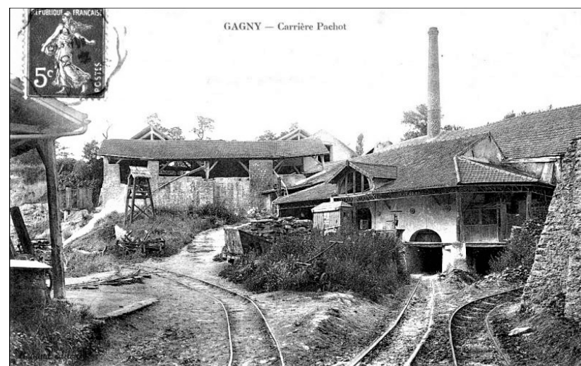
Carrière de l'Ouest en 1900 à Gagny

En 1900 la carrière de l'Ouest était exploitée par les établissements Pachot « Un chemin de fer traversait un souterrain de 40 mètres (...) allant de l'usine (7) à la gare de Gagny et servait au transport des produits