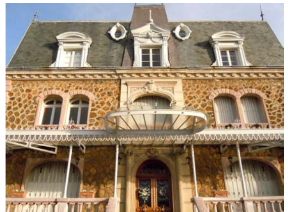
26 avenue Gallieni - maison de maître - meulière - mascaron - terrasse - marquise - toit mansart - ardoises - lucarnes et donjon avec 2 épis de faîtage

Si Villemomble a encore un cadre de vie agréable c'est grâce, sans doute, au fait que les grands domaines ont été lotis dès la fin du XIX ème siècle en même temps que le parc royal du Raincy, créant ainsi des quartiers résidentiels qui étaient au commencement, des lieux de villégiature au milieu de parcs et de bois. Aujourd'hui dans chaque quartier s'élèvent des écoles et des bâtiments sportifs en nombre suffisant. Il serait peut-être approprié de construire un Espace des Arts, proche de la vaste médiathèque et du Conservatoire de musique, à la place de l'ancien Conservatoire, 49 Grande Rue ou préempter des pavillons voués à la démolition pour construire des immeubles dans une zone proche du centre de la ville (Av du Raincy, Av Outrebon, Bd du Général de Gaulle). La salle des fêtes (Théâtre Brassens) serait transformée en cinéma d'Art et d'essai et l'Espace des Arts disposerait en plus d'une salle de théâtre de 600 places pouvant accueillir des spectacles nationaux en avant-première, des salles destinées à des associations.