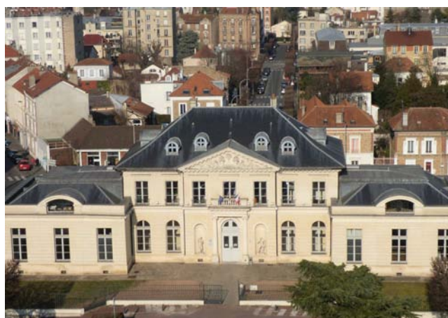
Le château seigneurial de Villemomble

Que de villes qui nous entourent, ont été massacrées depuis des décennies par des vandales inconscients et irresponsables. Bien sûr, Le Raincy une fois confisqué au milieu du XIX ème siècle est devenu une commune riante, riche, lotie pour une bourgeoisie aisée mais quand même il faut regretter la disparition du château du Raincy qui était une des demeures les plus somptueuses des environs de Paris qui annonçait Vaux-le-Vicomte !