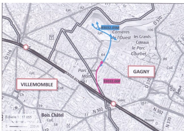
Emplacement des carrières de l'Ouest en 1950 - Gagny