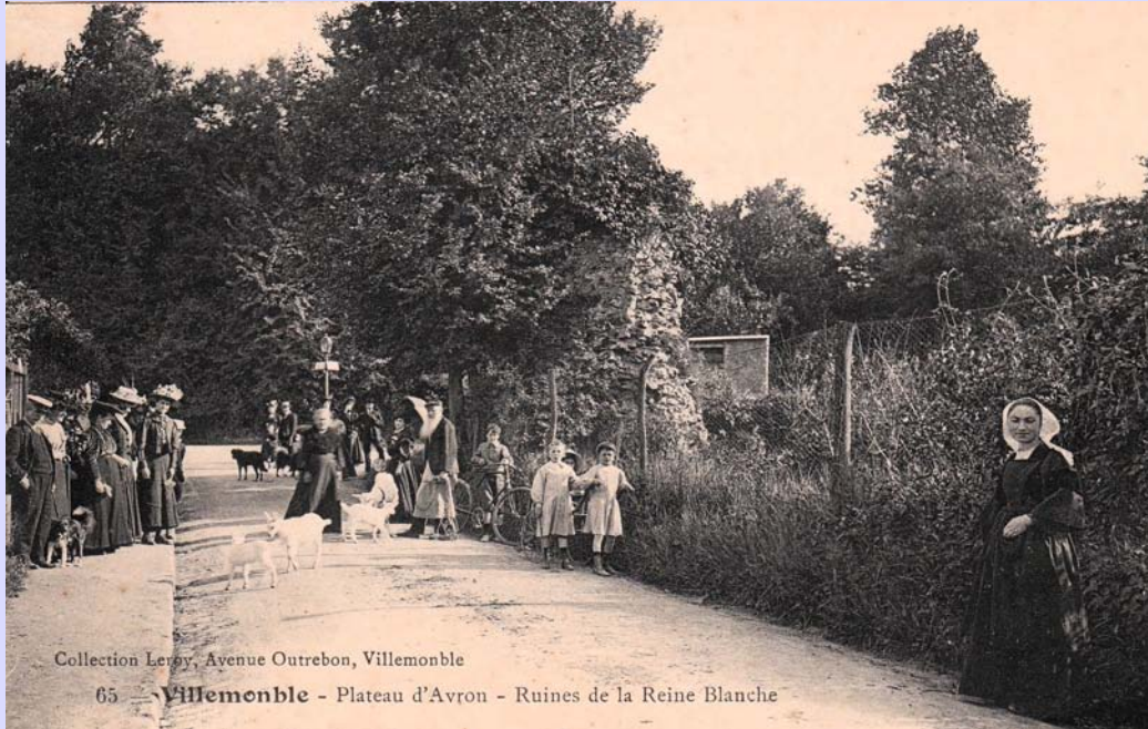
Collection Leroy, Avenue Outrebon, Villemoble