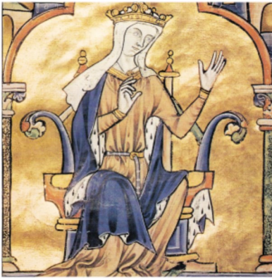
Blanche de Castille

« Une légende non dépourvue de fondement attribue la possession d'un château sur le plateau d'Avron à Blanche de Castille (2). Il se pourrait fort bien que ce fut pour cette raison que Jean de Beaumont (3), seigneur de Villemomble, chambellan du Roi Louis IX, fit attribuer la nomination du curé de Villemomble à l'abbaye naissante de Livry que l'on pouvait rejoindre par un long chemin à travers bois appelé et noté sur les cartes « Route Blanche ». Blanche qui n'aimait pas le tumulte de Paris séjournait dans maints endroits autour de la capitale et du Louvre, de Pontoise à Saint-Germain-en-Laye, Melun et autres lieux où elle avait fait construire les abbayes de Royaumont, de Notre-Dame-la-Royale à Maubuisson et de Notre-Dame-du Lys, près de Melun ! Dans « L'annuaire des environs de Paris, 1836 », l'historien Leblanc de Ferrière écrivait ceci « Villemomble à deux châteaux : l'un fut habité jadis par la reine Blanche, il était à cette époque entouré d'eau ». Cet honorable