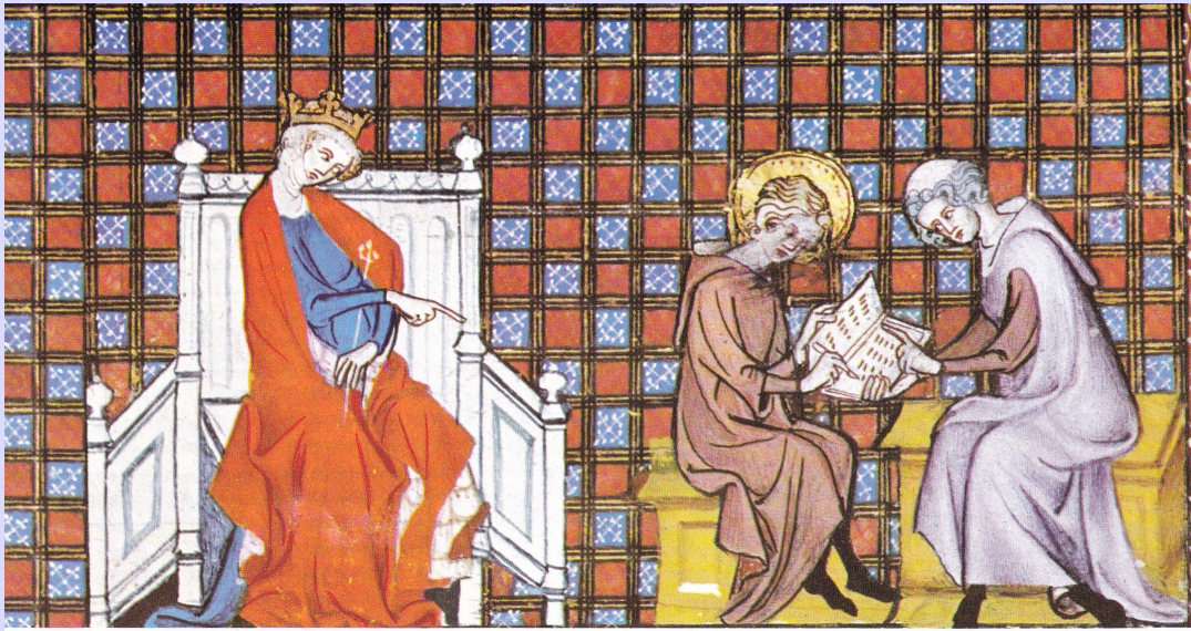
Blanche de Castille surveille l'éducation de son fils