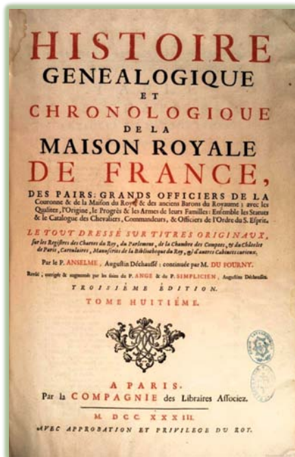
P. Anselme Histoire de la Maison Royale