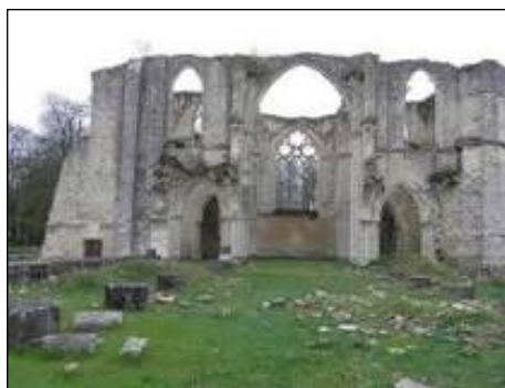
Vestiges de l'abbaye de Maubuisson