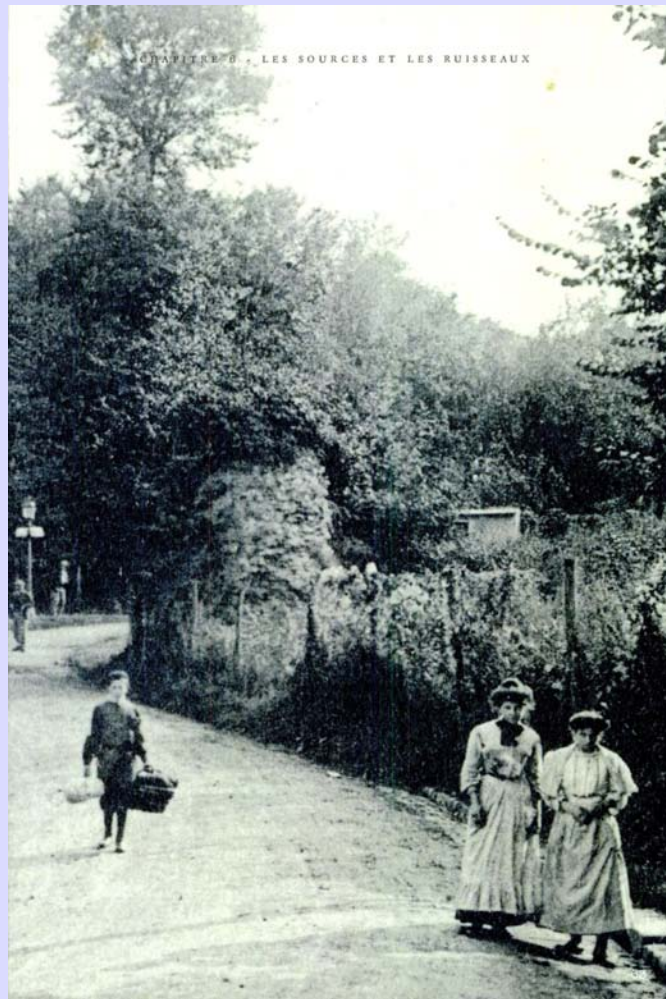
Ruines du château de la dame blanche