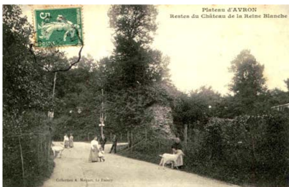
Ruines du château